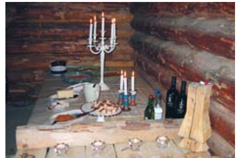
Rallarkojan – rustik och genuin rallarmiljö för mindre grupper, lämpligt vid måltider och samkväm.