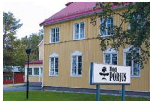
Hotell Porjus har konferensrum för cirka 20 personer, fullständig service och boende.