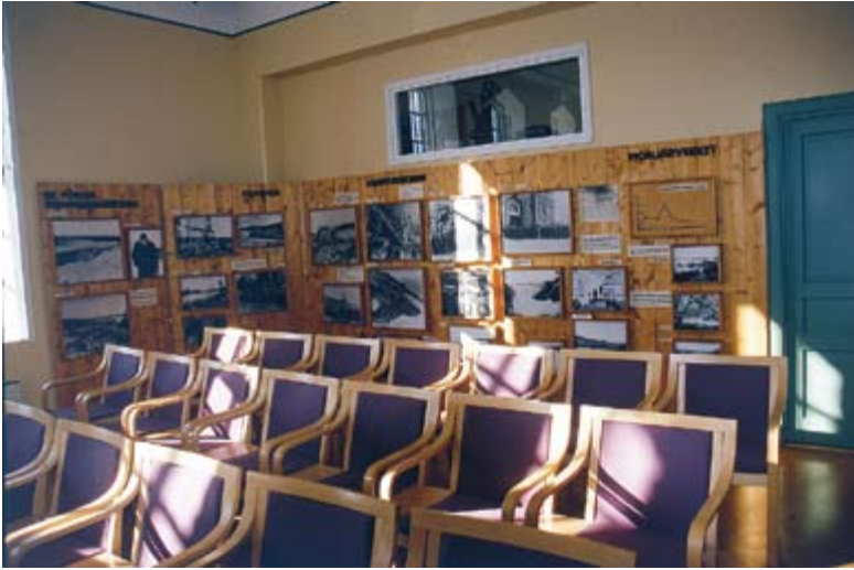
Porjus Expo – film- och föreläsningssal, lämplig för upp till 40 personer.