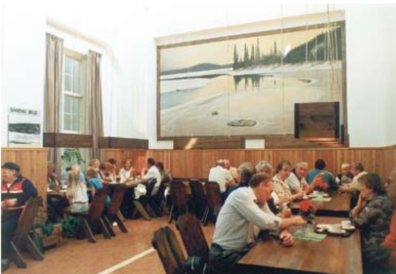
Linas Café – färgstark inramning för matupplevelser och mindre sammankomster.

Del av sporthallen festligt dukad för 240 middagsgäster.