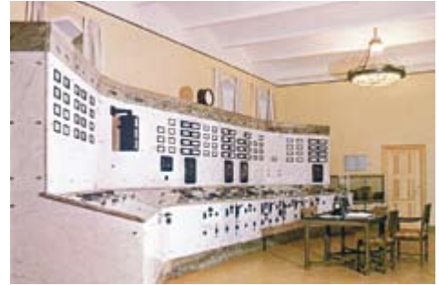
Gamla kontrollrummet, historisk miljö med marmorpaneler för exempelvis trevligt mingel under lättare former.